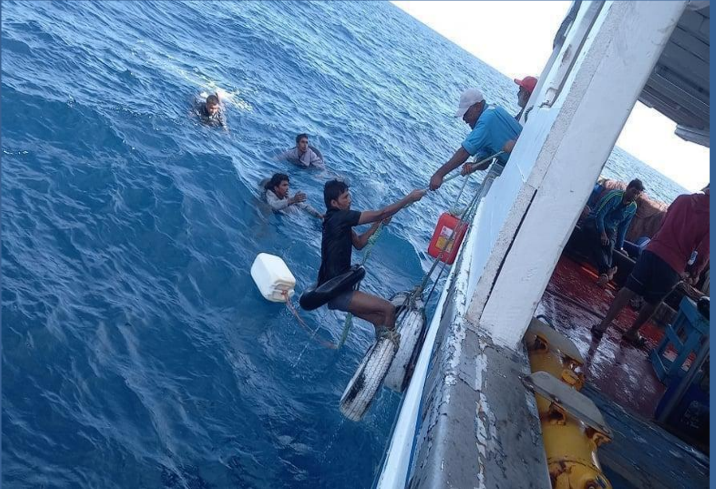
إنقاذ زورق لأشخاص منكوبين من قبل صيادي جرجيس الناشطين بجمعية "الصيد للتنمية والبيئة"

غالبًا ما نترك وحدنا في عملية إنقاذ الناس وأحيانًا بدون أي دعم من السلطات لمدة 20 ساعة أو حتى أكثر. نحن ملزمون بإجراء عمليات الإنقاذ بأنفسنا - إنه التزام إنساني ونفعل