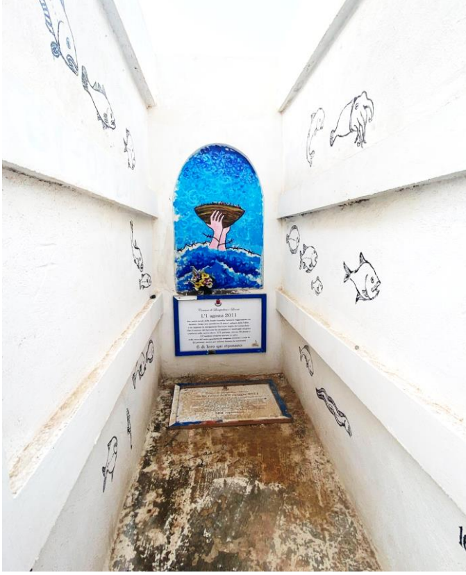
Cemetery in Lampedusa

سيتم تنظيم نشاط إحياء الذكرى الأكبر التالي في جرجيس، تونس في الفترة من 3 إلى 6 سبتمبر 2022 بتنظيم عائلات المختفين وأنصارهم.