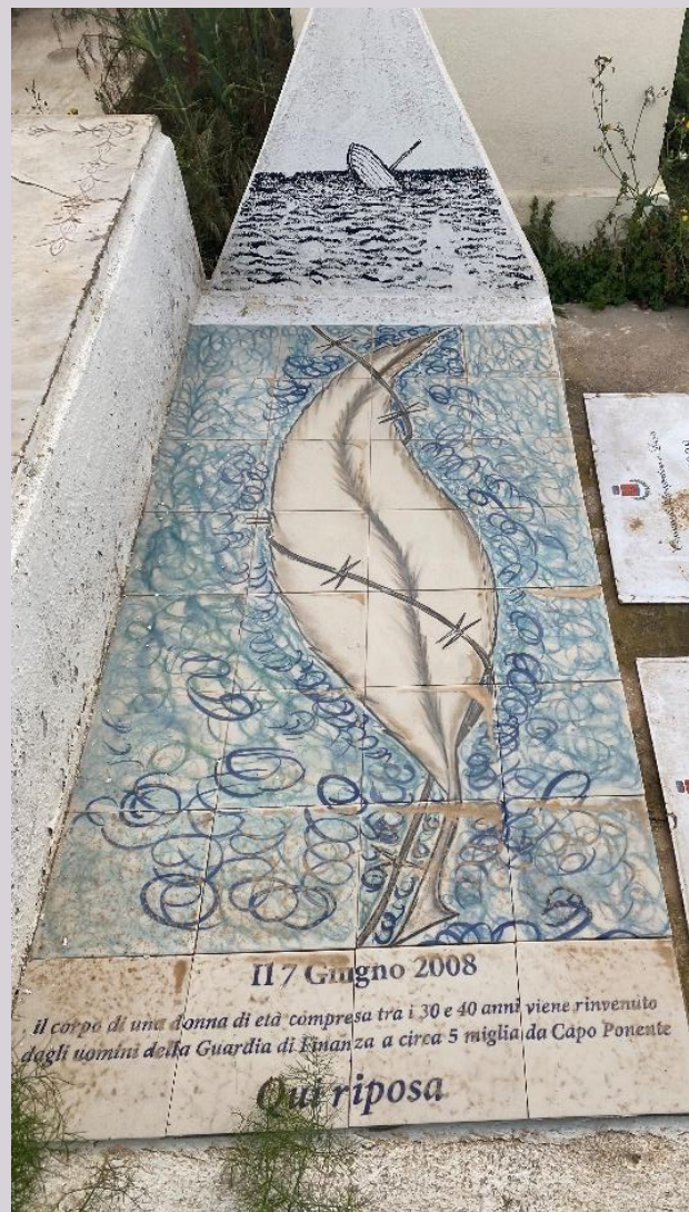
Cimitero di Lampedusa.

Alcune delle soluzioni potrebbero includere l'istituzione di un sistema coordinato di ricerca e identificazione, l'introduzione dell'obbligo di identificare le vittime nella legislazione nazionale, europea e internazionale, e l'offerta di un supporto concreto alle famiglie. Tuttavia, se questo rimane un obiettivo "secondario", non è a causa della mancanza di assoluta necessità di identificare tutte le vittime, garantire loro un trattamento e una sepoltura dignitosa, nonché fornire alle famiglie una risposta sul destino dei