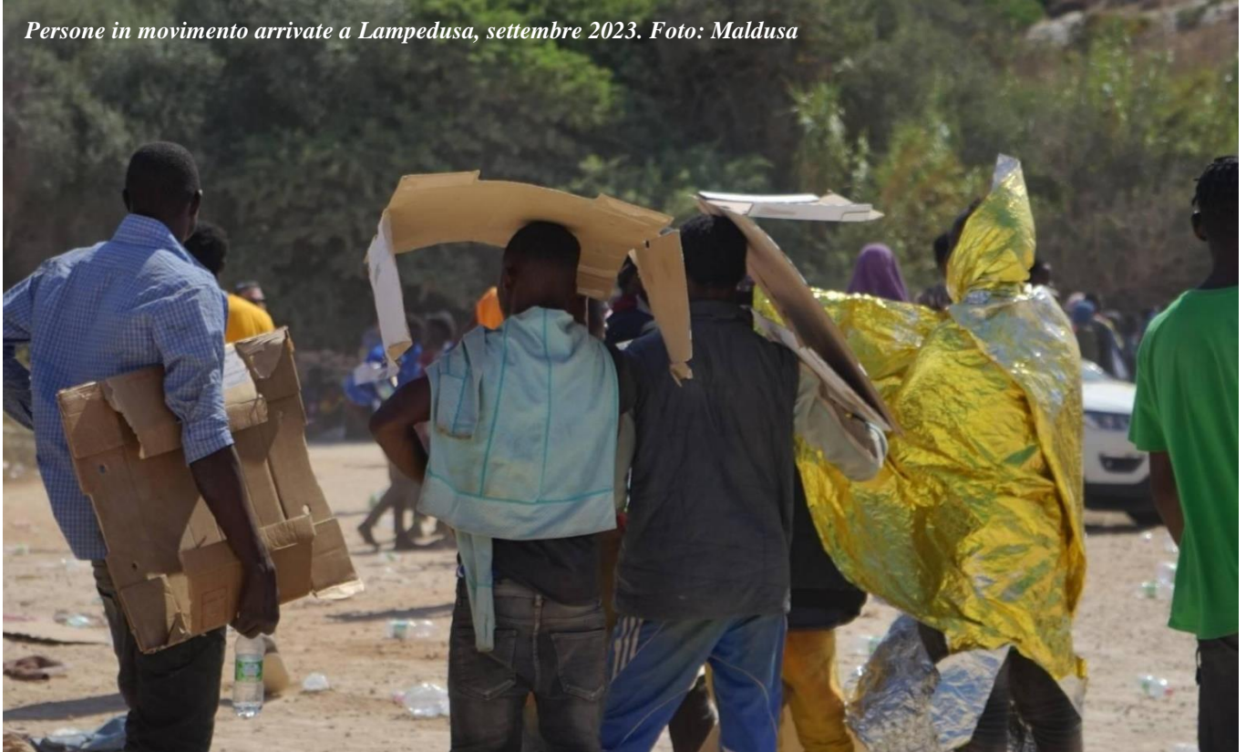
Persone in movimento arrivate a Lampedusa, settembre 2023.

La visita di Meloni e Von Der Leyen a Lampedusa il 17 settembre ha segnato un brusco ritorno a una normalità intollerabile. La porta dell'Hotspot si è chiusa nuovamente, con all'interno 1.700 persone in gravi condizioni di sovraffollamento e sporcizia. Durante la visita, un cordone di polizia ha impedito ai migranti di avvicinarsi all'ingresso principale, che era stato riaperto solo per la passerella delle autorità. La lunga strada che porta all'Hotspot era nuovamente vuota, presidiata dall'esercito. Anche il molo Favalaro era stato ripulito dopo giorni in cui era stato teatro di indecenza e disumanizzazione, in cui centinaia di persone erano state costrette a rimanere lì per ore, senza avere accesso a cibo, servizi igienici e cure mediche adeguate.