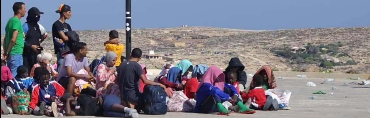
Personne in movimento arrivate a Lampedusa, settembre 2023.