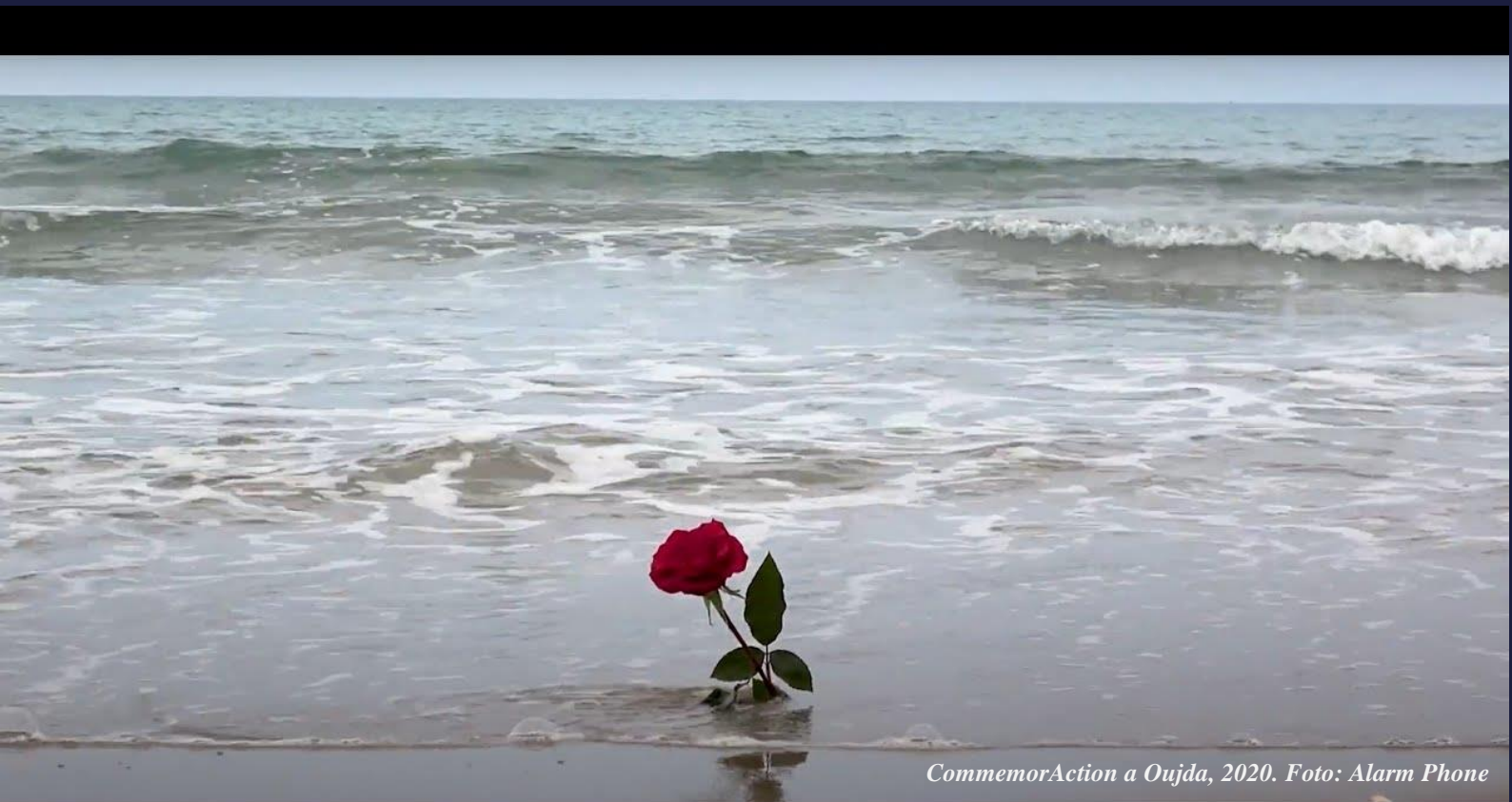
CommemorAction a Oujda, 2020.

da Home , un monologo di Giuseppe Cederna