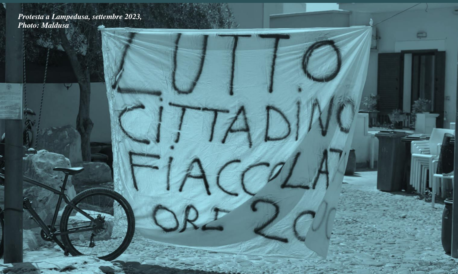
Protesta a Lampedusa, settembre 2023

Le persone continueranno a sfidare coraggiosamente e a superare confini violenti e mortali ogni giorno. Le persone continueranno a lottare per esercitare il loro diritto di migrare e di scegliere dove andare, chiedendo dignità e libertà.