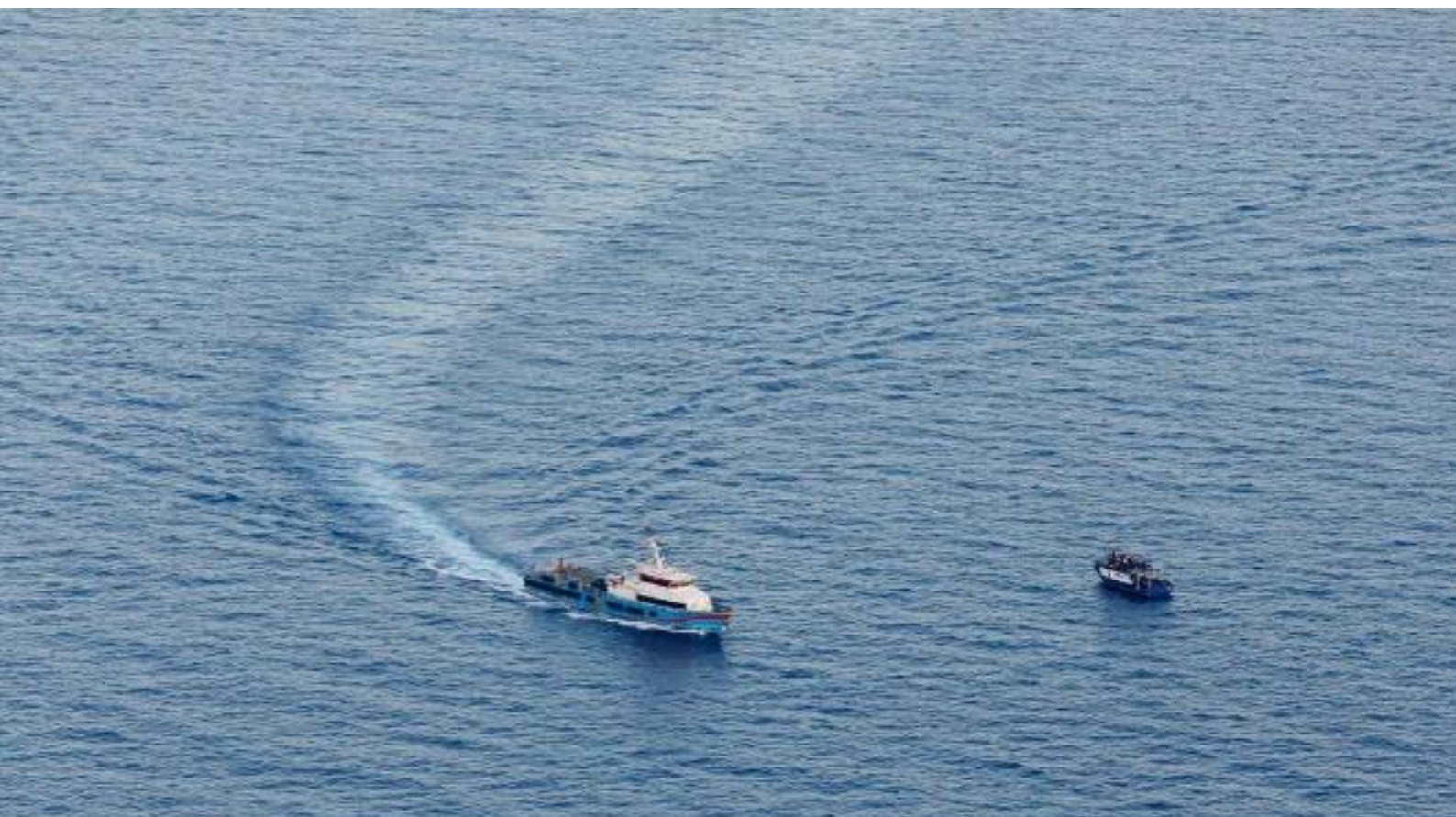
Intercettazione da parte delle milizie Tariq Ben Zayed di Haftar di ~250 persone in distress nel luglio 2023

Nel settimo numero di Echoes, in un articolo sulla SAR 3, abbiamo segnalato la presenza di un nuovo attore nei respingimenti a Bengasi: una milizia chiamata Brigata Tareq Bin Zayed. Nelle ultime settimane hanno rimorchiato via dalla zona di Ricerca e Soccorso (SAR) maltese una nave con a bordo 500 persone, portandola in Libia. Ma non è tutto: hanno addirittura rapito 110 persone che erano a bordo di una barca salpata dal Libano ma mai arrivata nella zona di Ricerca e Soccorso (SAR) libica. Naturalmente, queste intercettazioni sono avvenute in stretta collaborazione con le autorità italiane, maltesi e dell'UE (Frontex) , che non perdono mai l'occasione di impedire a rifugiati e migranti di raggiungere le coste europee. La brigata è controllata da Haftar, un dittatore della Libia orientale. Nel maggio del 2023, Meloni lo ha accolto in una visita ufficiale a Roma.